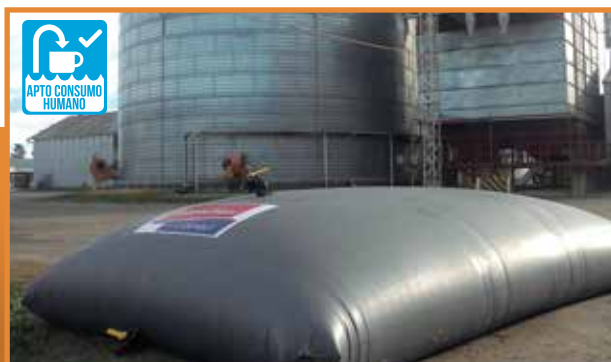
Tanque de recuperación pluvial